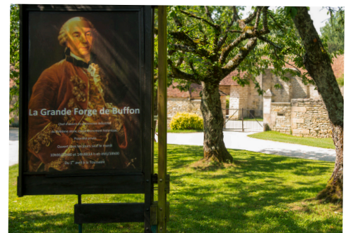
La Grande Forge de Buffon