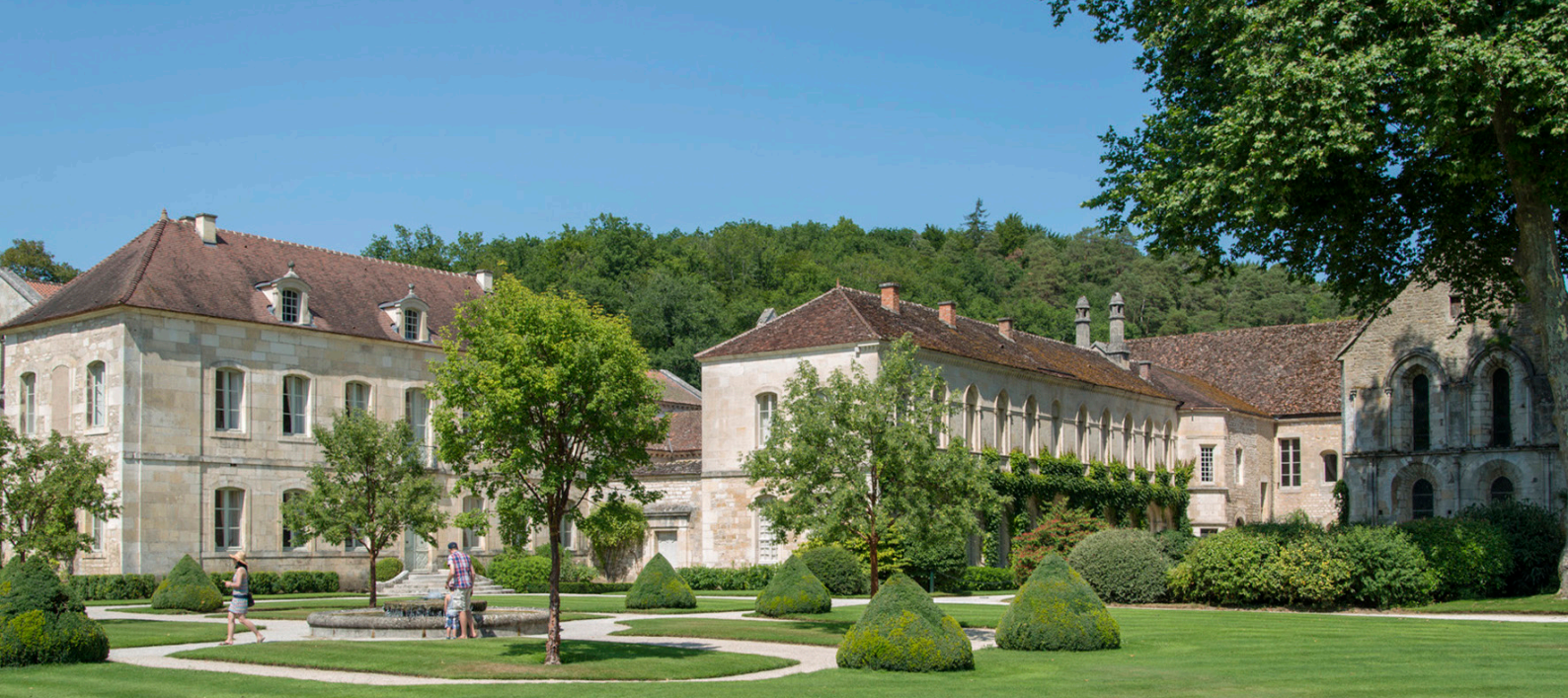
Abbaye de Fontenay