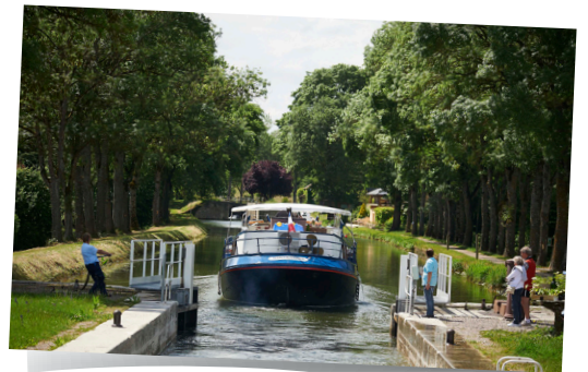
Bateau écluse